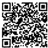
แบบรับฟังความคิดเห็น ร่างกฎกระทรวงฯ จ.ชลบุรี

กองอนุรักษ์ทรัพยากรป่าชายเลน ส่วนอนุรักษ์และฟื้นฟูทรัพยากรป่าชายเลน โทรศัพท์ ๐ ๒๑๔๑ ๑๓๑๙