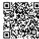
แบบรับฟังความคิดเห็น ร่างกฎกระทรวงฯ จ.ฉะเชิงเทรา