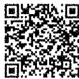
แบบรับฟังความคิดเห็น ร่างกฎกระทรวงฯ จ.ระยอง